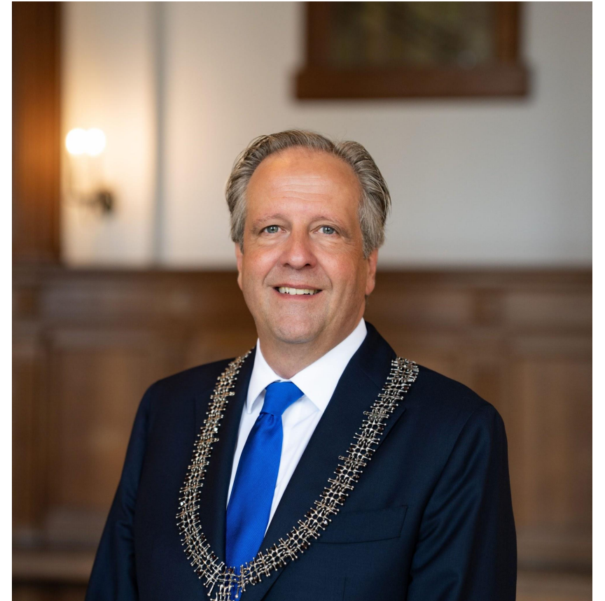
Burgemeester Pechtold van Delft