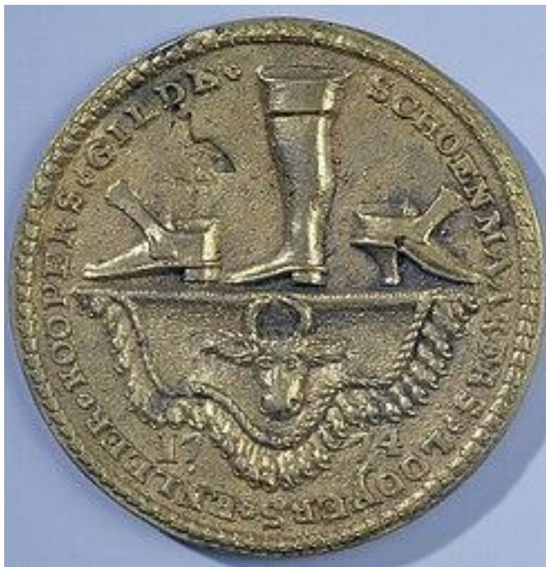
Schoenmakers- looiers- en leerkopersgilde van 's-Gravenhage, gildepenning van een vrijmeester