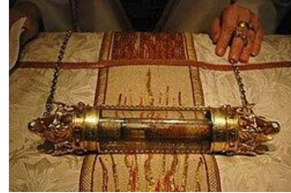
Bloed van Jezus