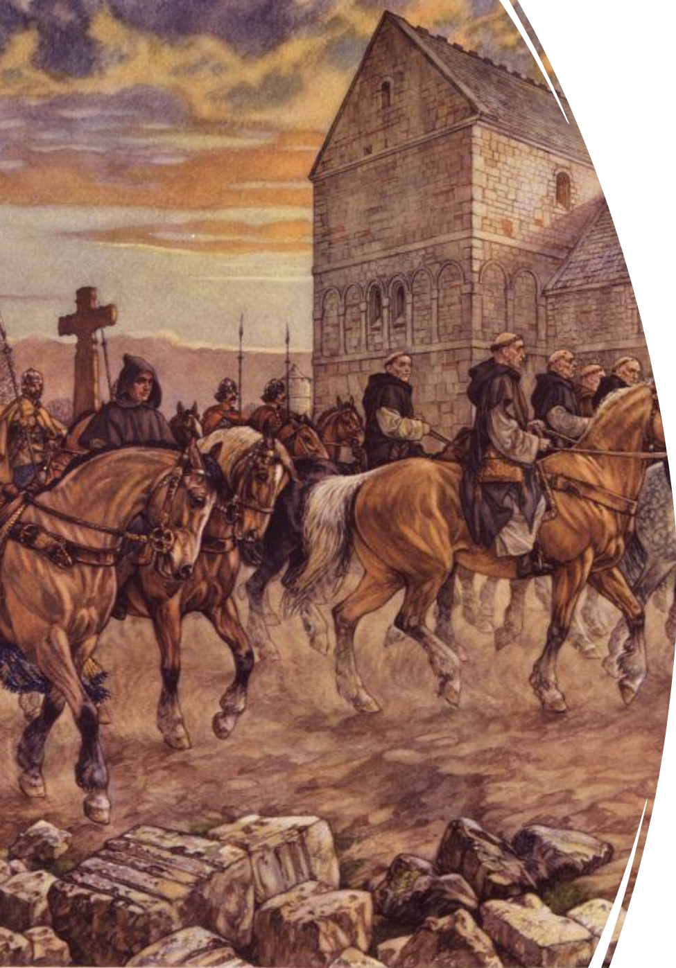
WILLIBRORD, DE APOSTEL DER FRIE